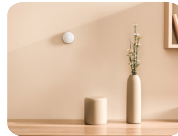
원하는 곳에 붙입니다