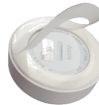
보호 필름을 벗기고