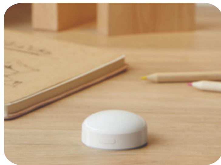
원하는 곳에 올려 둡니다